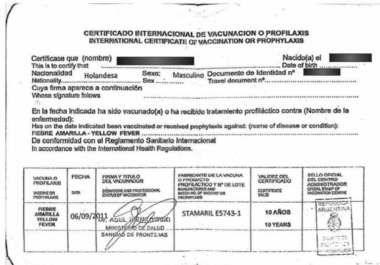
Bijlage 1: Voorbeeld certificaat inenting